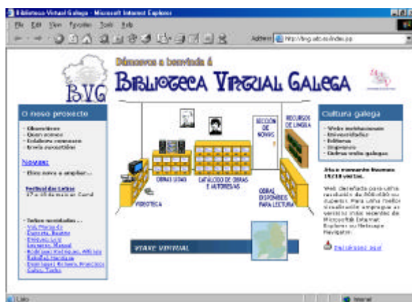
Fig. 1. Biblioteca Virtual como metáfora de una biblioteca real

Un aspecto interesante que permite nuestro catálogo virtual de autores es que éstos pueden ser accedidos no sólo por una letra, sino por varias. De este modo, nuestra escritora más relevante del siglo XIX, Rosalía de Castro, aparece tanto en la ficha de la R como en la ficha de la C, aunque en este segundo caso aparece como Castro, Rosalía de. Esta asociación de los autores a varias letras es posible gracias al tratamiento independiente de los “alias” de los autores, lo que nos permite no sólo anticiparnos a las diferentes tendencias de búsqueda de los distintos usuarios, sino también resolver de forma natural el hecho de que muchos autores firman con diferente pseudónimo obras de distinto género.