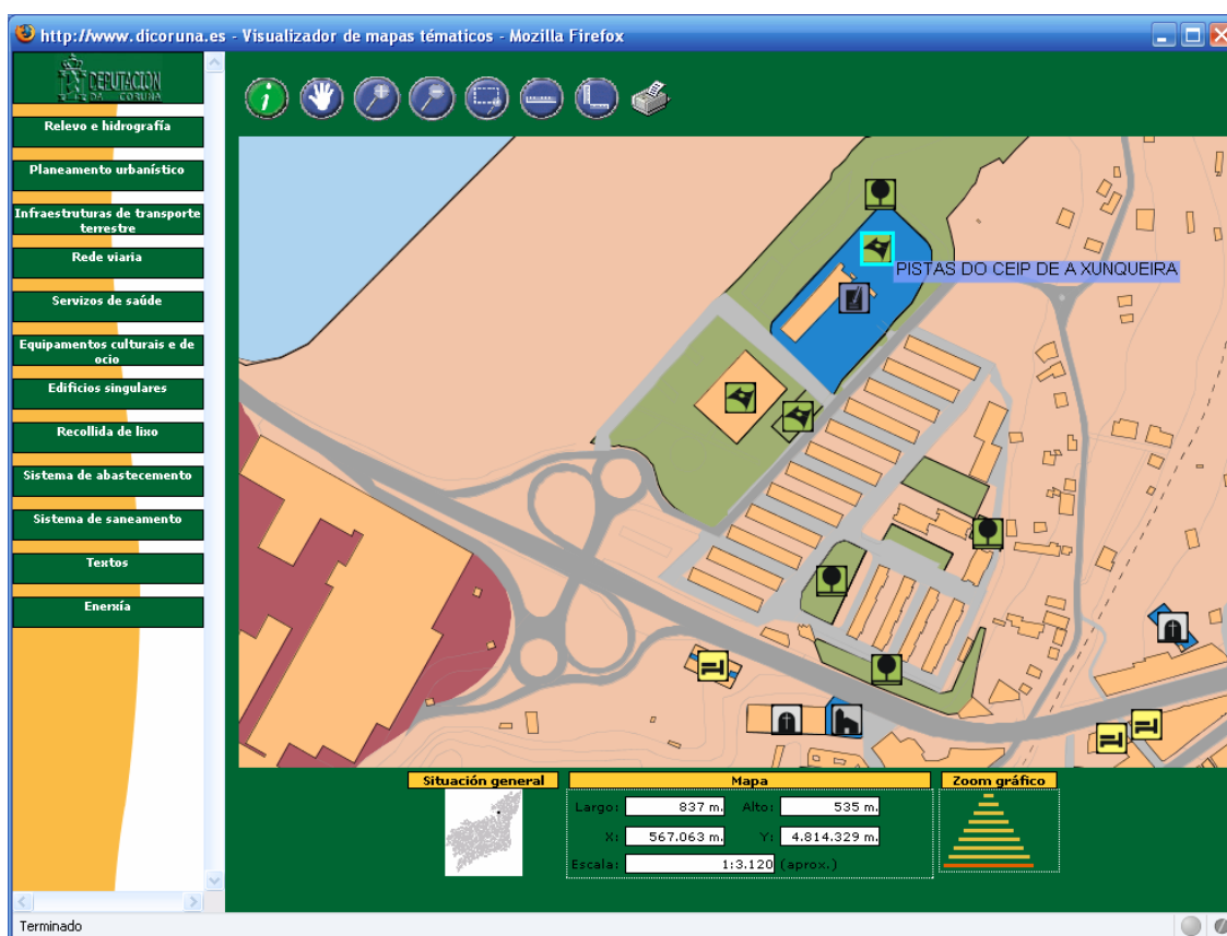
Figura 2. Visualizador de mapas basado en un applet Java

Por otra parte, para los usuarios en general cuyo principal interés es consultar la cartografía, se ha diseñado una versión mucho más sencilla de la interfaz que utiliza imágenes para visualizar la cartografía y está desarrollada utilizando únicamente tecnologías HTML y JavaScript. Esta versión permite que la aplicación pueda ser ejecutada en cualquier navegador web, sin más requisitos. Además, su sencillez hace que sea indicada para usuarios poco o nada expertos en el manejo de sistemas de información geográfica.