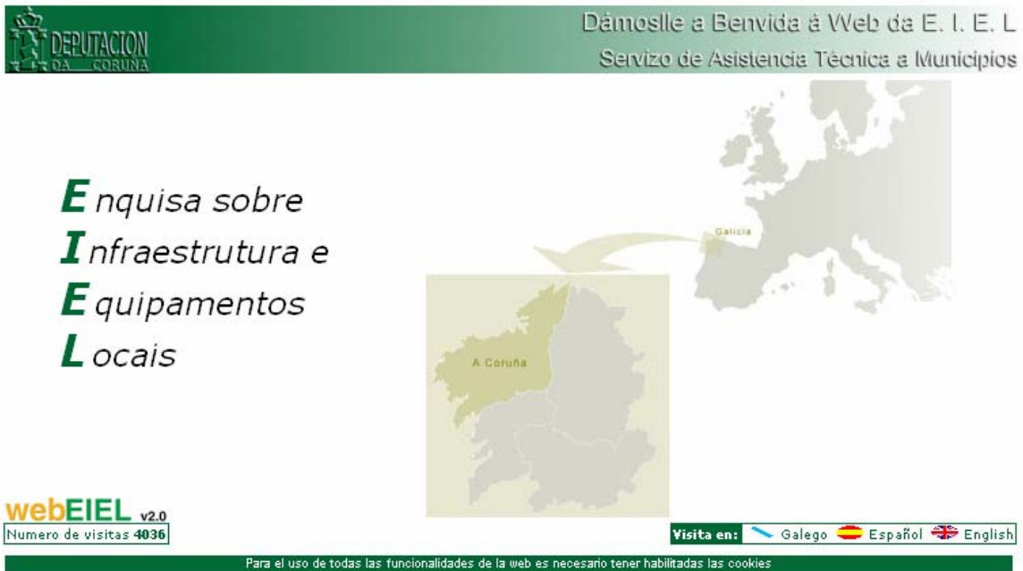
Figura 1. Pantalla inicial de WebEIEL