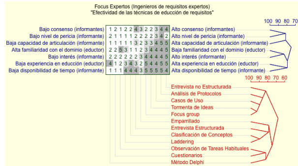
Fig. 2. Análisis de conglomerados para el ingeniero experto.

Estas figuras muestran los árboles con los que se ha analizado la equiparidad y similitud de las técnicas y las características. En ambas aparece una agrupación formada por la Tormenta de Ideas y Focus Group , con un 92,9% de equiparidad. Es la única coincidencia, pues el resto de agrupaciones de técnicas de noveles y experto difieren. Por motivos de espacio no se detallan más grupos ni porcentajes.